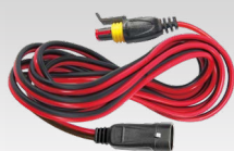
Förlängningsladd 2,5 m - 029057