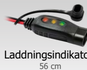
Laddningsindikator 56 cm